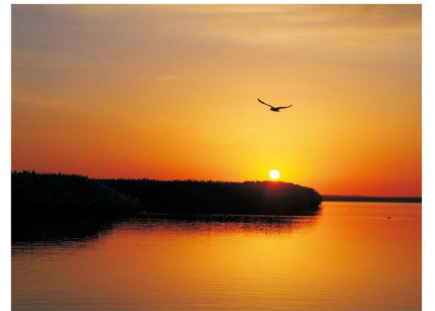
旭日 / 广州分行 李璐璐