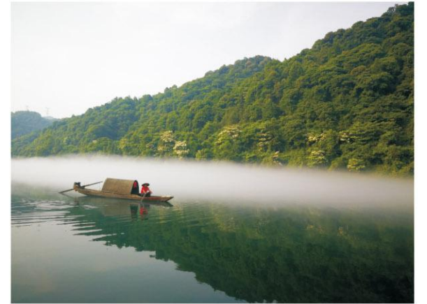
雾漫小东江 / 总行法律合规部 林丹丹

别人压缩过的知识不是你的知识，别人讲的道理，听的再多，没有自己的经历、感悟和思考，那还是别人的道理。这本书每看一遍都会有不同的感悟，也推荐有兴趣的朋友看看。也许，《乌合之众》并不是人类社会群体行为的答案之书，但是，我想他一定可以启发我们去独立思考，最终在自己的人生中找到属于自己的答案。📖